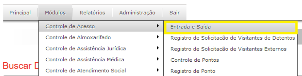
Figura 1 - Controle de acesso/entrada e saída.

Clicar na opção “Módulos”, localizada no Menu principal, selecionar opção “Controle de Entrada de Acesso e Entrada e Saída”, conforme a figura 01: