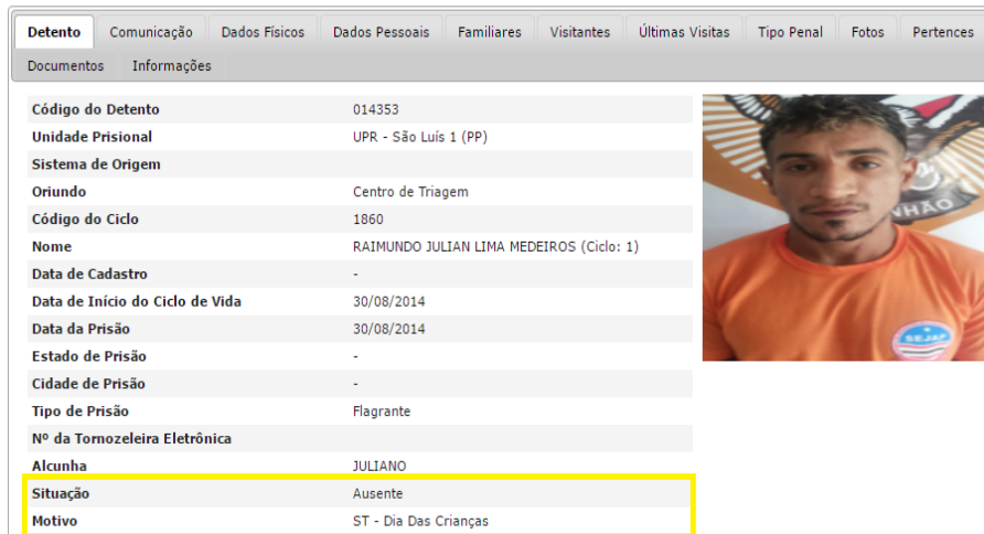
Figura 9 - Ficha do Preso - Situação Ausente.

Conforme a figura 09 abaixo o preso deve estar em situação Ausente pelo motivo de Saída Temporária.