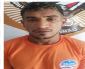
Figura 13 - Ficha do Preso em Situação Inativo.

As instruções supracitadas, a partir deste, serão exigidas pela Supervisão do SIISP. O não cumprimento deste poderá acarretar em responsabilização funcional ou extinção contratual, conforme o caso.