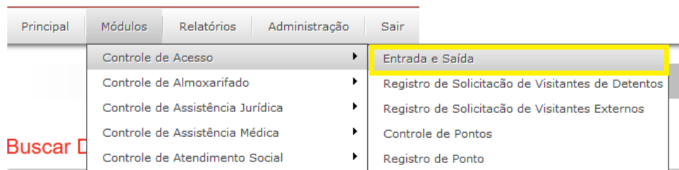
Figura 2 - Controle de Acesso / Entrada e Saída.

O operador deve clicar na opção “Módulos” localizada no Menu Principal, selecionar opção “Controle de Entrada de Acesso e Entrada e Saída” conforme a figura 02, ou clicar no ícone de entrada e saída, um atalho na página inicial conforme a imagem 03 abaixo.